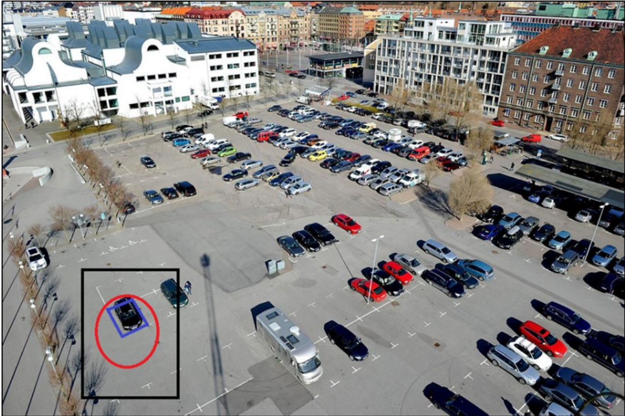
Figur 2. Parkeringsplats (blå fyrkant) och parkeringsyta (röd cirkel).

relevant, alltså inte enbart parkeringsplatsen. Detta eftersom bilar ännu inte kan flyga in i parkeringsrutan, utan behöver omkringliggande plats för manövrering in till, och från parkeringsplatsen.